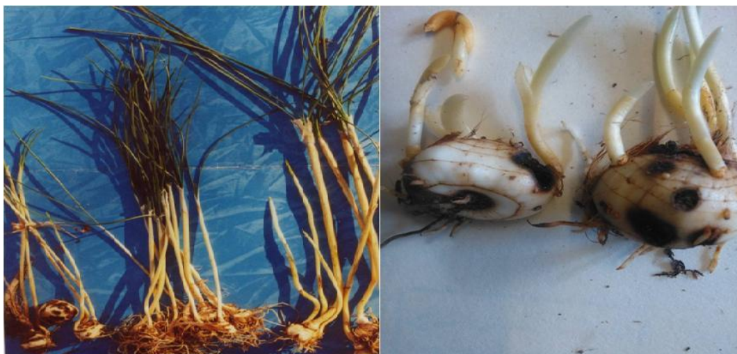
شکل ۲) راست (پوسیدگی ناشی از فعالیت کنه)، چپ (مقایسه بوته سالم و آلوده)

۴- ضد عفونی بنه: از آنجائی که ضد عفونی اندام های تکثیر جزو اصول کشاورزی پایدار است لازم است