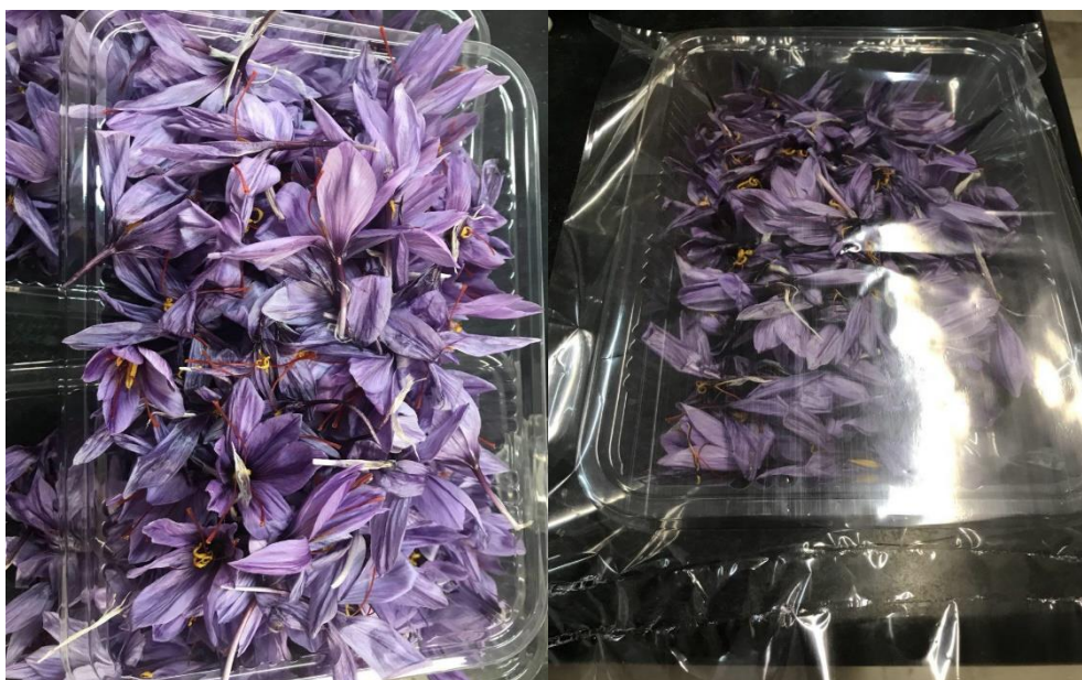
شکل ۱، بسته بندی گل زعفران

زمان (روز) نمونه ها به فواصل زمانی ۲، ۴، ۷، ۱۴ و ۲۱ ذیل از سردخانه خارج شده و پس از جداسازی کلاله از خامه و خشک کردن در آون ۶۰ درجه سلسیوس به مدت ۱۵ دقیقه خشک گردید و آزمونهای شیمیایی بر روی آنها انجام شد.